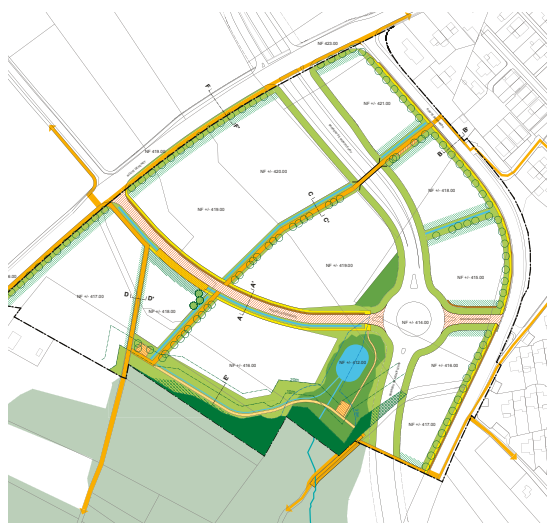
Charpente paysagère : continuités et coutures

Le projet propose également la mise en réseau des espaces paysagers de valeur biologique et de loisirs de la zone à travers un maillage d'espaces à fonctions différentes. Il garantit la perméabilité de la zone par les espaces verts et la biodiversité et met en lien la ZITUIL avec son contexte afin de lui donner un caractère et une identité propre indépendante de celle de la ZIMEYSAVER.