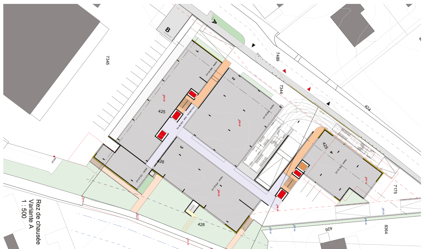
Source LMAU - Rez-de-chaussée Variante A