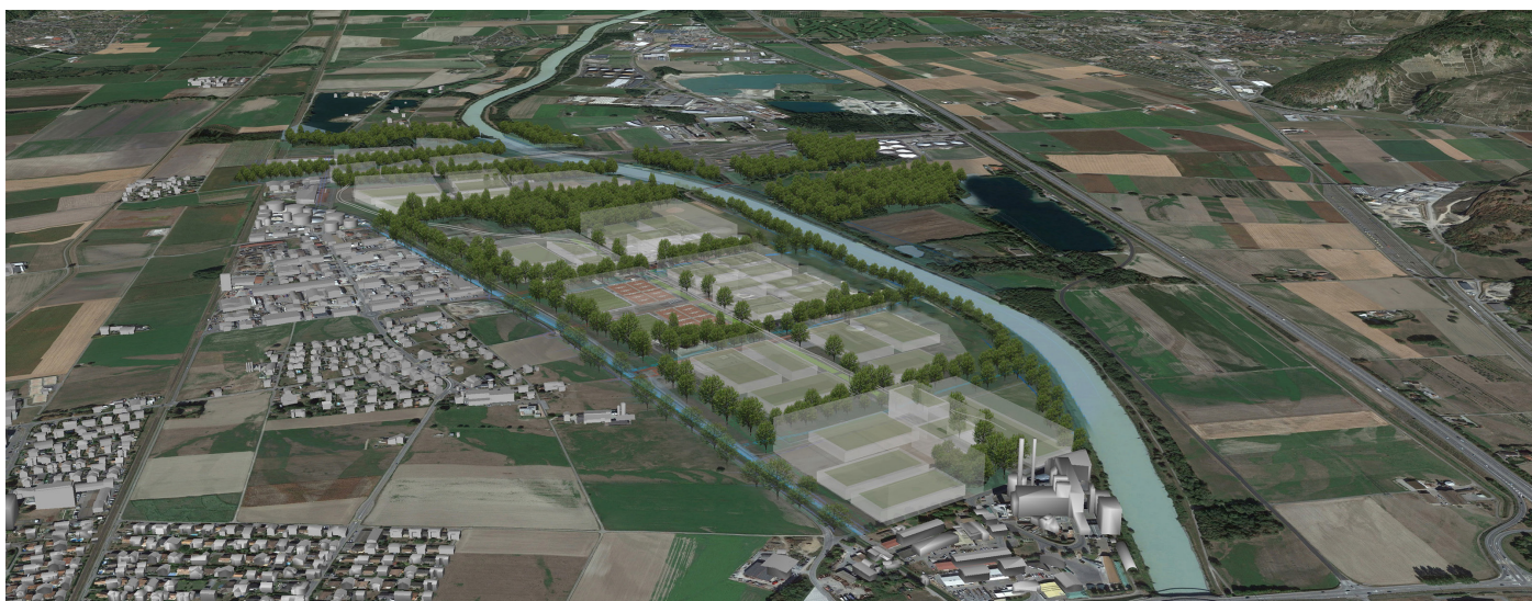
Projection 3D du potentiel développement du site Ancienne Raffinerie - Charbonnière - L'Enclos // LMAU