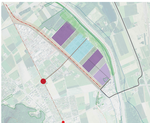
Vocations futures du site de l'Ancienne Raffinerie // LMAU

La démarche menée a permis de fédérer les propriétaires privés et publics autour d'une vision co-construite pour la requalification et la restructuration du site. L'ensemble des résultats du masterplan a été validé par les différents acteurs impliqués et la commune de Collombey-Muraz a intégré le masterplan dans sa planification communale. Suite au masterplan, l'élaboration d'un plan d'aménagement détaillé a été lancée début 2023.