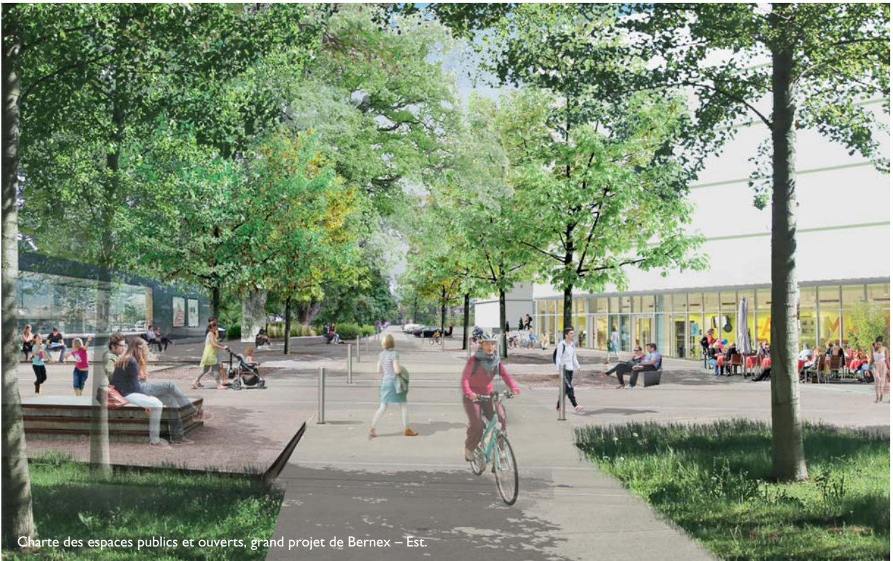
Charte des espaces publics et ouverts, grand projet de Bernex – Est.