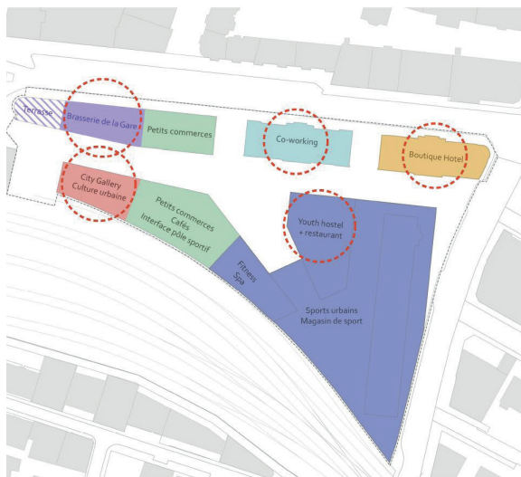
Plan de l'affectation du bâti

La mission de l'agence a été de formaliser le projet issu des MEP en plan d'affectation comprenant un plan, un règlement ainsi qu'un rapport 47 OAT. Le projet prévoit la préservation des bâtiments de l'avenue de la Gare 41 et 43 ainsi que du bâtiment Horizon le long de l'avenue d'Ouchy, la création de logements, de surfaces de bureaux, de services et de loisirs, pour un total de 73'000m2 de surfaces de plancher. Il inclut également l'aménagement de nouveaux espaces publics au cœur du quartier et en lien avec la place de la Gare. Ce projet d'envergure nécessite une coordination étroite tout au long du projet avec les Maîtres d'ouvrage, le bureau AMO, les bureaux spécialistes ainsi qu'avec la Ville de Lausanne afin d'élaborer un plan d'affectation permettant de répondre aux enjeux complexes et multiples du projet.