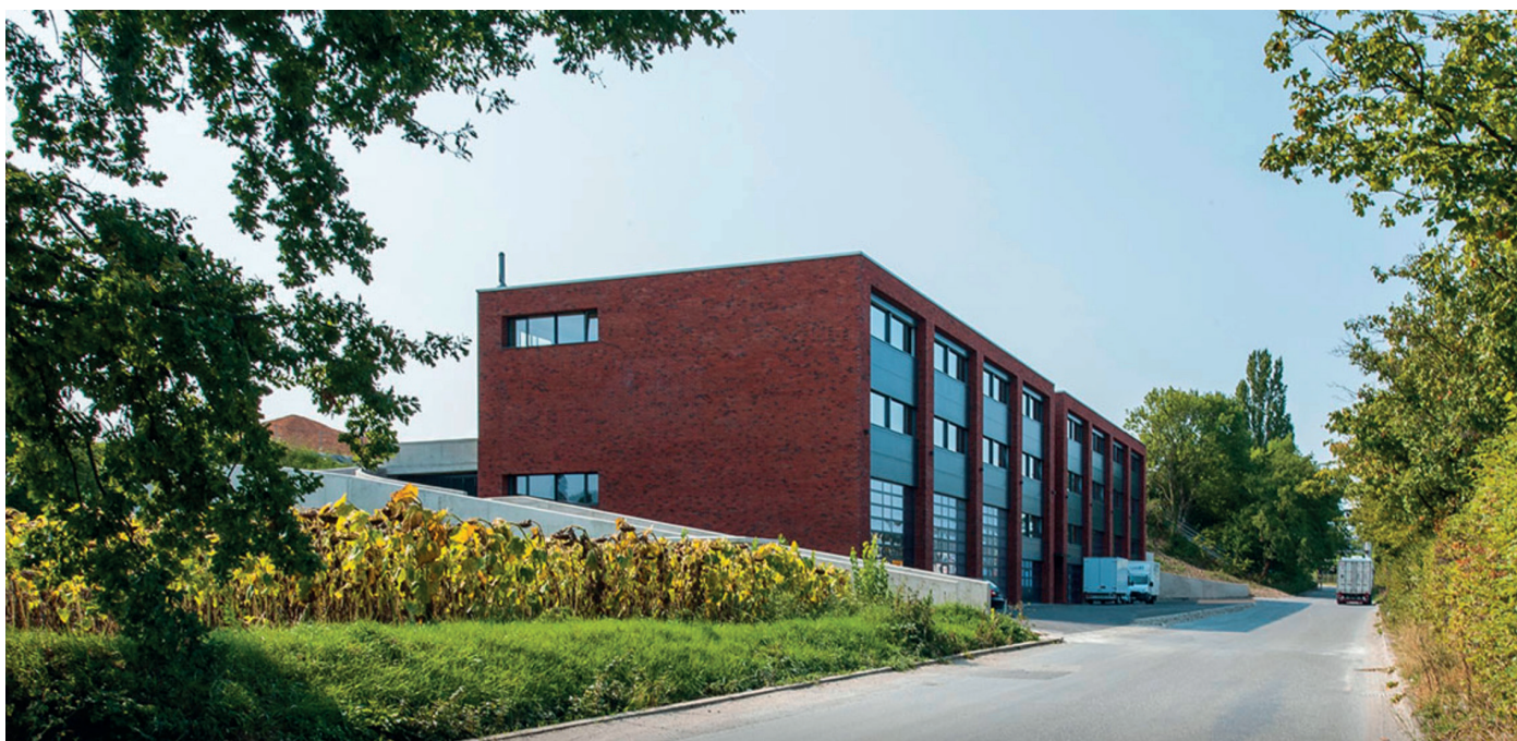
Vue extérieure - principe d'accès depuis le domaine public