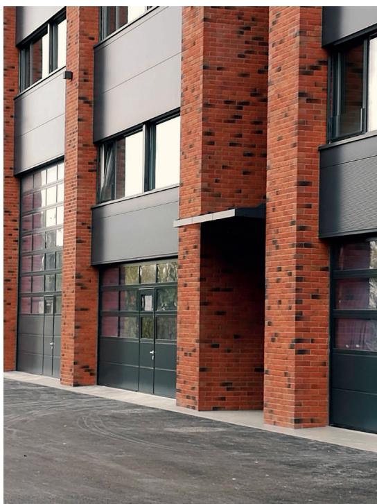
Vue extérieure - principe d'accès depuis la cour supérieure

Le projet prévoit un double rez de chaussée, donc 2 niveaux accessibles de plain-pied pour les poids-lourds. La hauteur libre permet la réalisation de mezzanines en fonction des besoins des usagers. Le projet prévoit dix-sept surfaces mises à disposition des entreprises et une surface de plancher totale de 4'200m 2 .