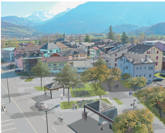
Maillage des espaces publics // LMAU

Compte tenu des contraintes existantes liées au stationnement et au couvert existant, l'aménagement retenu inclue les éléments suivants: Arborisation: essences indigènes, résistantes aux hivers rigoureux; Gestion herbacés: plantes rustiques, espace propice au développement de la biodiversité; Plan végétation pérenne: massifs de plantes pérennes et cespiteuses, espaces propices au développement de la biodiversité; Plan matérialité des sols: béton désactivé - colclair - enrobé bitumineux; Plan mobilier: bancs avec inscriptions antiques (héritage en lien avec le site), fontaines à boire; Plan lumière adapté et repensé en fonction des usages et horaires d'utilisation ainsi que du voisinage. Mise en avant et valorisation de l'héritage patrimonial par la délimitation au sol par des pierres des anciennes bâtisses datant de l'époque romaine. Chiffrage des coûts des différents travaux.