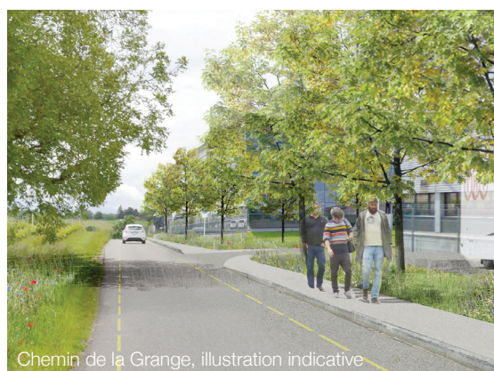
Chemin de la Grange, illustration indicative

Le PDZIA est accompagné d'une charte des aménagements, vouée à préciser les orientations concernant les espaces ouverts, les équipements de mobilités, le mobilier urbain, ainsi que certaines spécificités des bâtiments (normes environnementales, façades, etc.). L'agence a été chargée, par la suite, du projet d'ouvrage pour les aménagements extérieurs, ainsi que de l'assistance à maîtrise d'ouvrage pour l'opérationnalisation étagée de la zone.