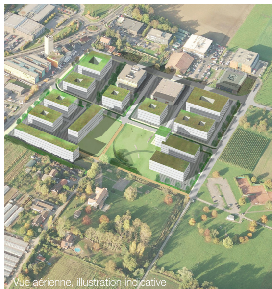
Vue aérienne, illustration indicative