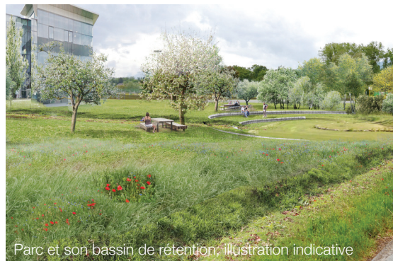
Parc et son bassin de rétention, illustration indicative