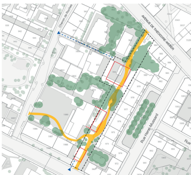
Stratégie de développement «Promenade urbaine»